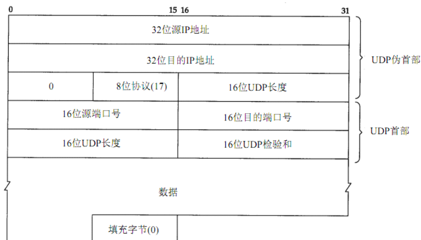
图 3：UDP 检验和计算过程中使用的各个字段

注：UDP 数据报和 TCP 段都包含一个 12 字节长的伪首部，它是为了计算检验和而设置的。伪首部包含 IP 首部一些字段。其目的是让 UDP 两次检查数据是否已经正确到达目的地（例如，IP 没有接受地址不是本主机的数据报，以及 IP 没有把应传给另一高层的数据报传给 UDP）。UDP 数据报中的伪首部格式如图 3 所示：