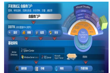
(微软开发测试云核心组件架构图)

为解决这一难题，在完成前期测试和评估之后，实验室和产品组决定充分利用现有的硬件资源，在完成大量服务器的虚拟化后，把多余的硬件充分再应用，投入到云基础架构上，实现资源池的概念，在投资相同或少于往年的情况下，实现了硬件资源利用的最大化，解决资源分配难问题。同时，针对 STB China 服务器分散且缺乏统一有效的管理这一现状，实验室经理决定引入系统中心虚拟机管理器作为云端服务配置工具，来提高用户体验，缩短服务时间。